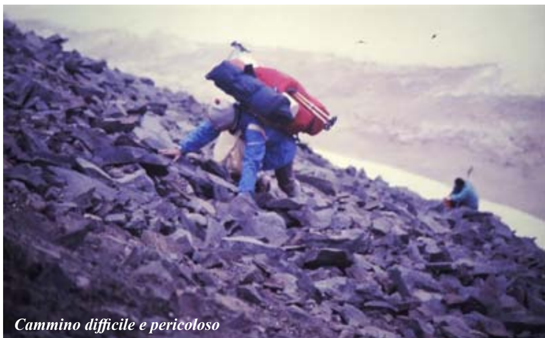
Cammino difficile e pericoloso

vale soprattutto per la costa occidentale della Spitzbergen, la sola praticabile, che in estate ha un mare completamente libero da ghiacci, discrete estensioni di territorio dove il disgelo è ampio, nonché temperature accettabili, da un - 3° fino a raramente +10° C. Un tempo terra di trappers , barche di balenieri, avamposto di spedizioni polari, oggi hanno un interesse eminentemente minerario (carbone), scientifico, peschereccio e strategico. Appartengono alla Nor-