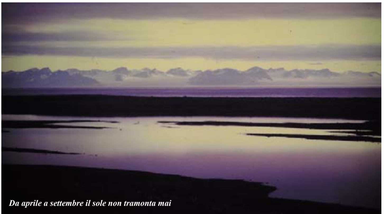
Da aprile a settembre il sole non tramonta mai

La terza fase ci ha visto porre un campo base tra le vecchissime casette in legno della miniera abbandonata di Moskushamn, sull'altro lato dell'Adventfjorden e scorrazzare più veloci e spediti per l'Advent City fin su nell'Hanaskogdalen e nella Malardalen, vallate monotonamente tutte uguali, e con nel cuore l'amarezza per la rinuncia all'escursione in barca al Tempelfjorden e ai suoi ghiacciai, causa avverse condizioni atmosferiche. E intanto raffiche di vento gelido e impetuoso, accompagnate da nevischio sibilano scuotendo violentemente le nostre tende. Il cielo è sempre più cupo da incutere paura. Siamo tornati al campeggio presso l'aeroporto e approfittiamo della locale cucina comune per cucinarci il cibo portato abbondantemente dall'Italia. Qui occorre portarsi tutto, obbligatoriamente, pena la negazione dello sbarco. Questo per non aggravare ancor più i già difficili approvvigionamenti della cittadina mineraria. L'aereo della SAS, che atterra anche in condizioni atmosferiche spesso al limite del proibitivo e che ci preleverà domani è visto ormai come la liberazione da un incubo! Strano fascino hanno queste isole...!