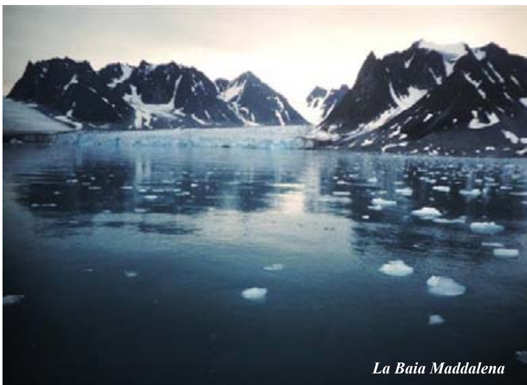
La Baia Maddalena

Intanto osserviamo le lunghe operazioni di imbarco di quintali di materiali nel nostro battello. Sono della spedizione scientifica torinese "Il Grande Nord", e meditiamo sulla grande importanza di certe attrezzature altamente "tecniche" e sull'appoggio, non solo morale, determinante per il successo di certe imprese artiche. Le raffrontiamo con una certa invidia ai nostri rattoppati zainoni, ai nostri umidi scarponi, alla nostra ingombrante cucina da campo, ai nostri 2 fucili noleggiati a Tromso per difenderci dagli orsi bianchi, alle nostre semplici tendine o ai nostri sacchi a pelo di piumino costateci sudati risparmi, in cui passiamo all'addiaccio, al freddo, stesi in coperta, la nostra "notte" artica dalla luce perenne. Il nostro viaggio oltre che in economia è fatto di emozioni, di sconcerti, ma anche di allegria ed esaltazioni visive. Basti ricordare la Baia Maddalena, un fiordo protetto quasi agli 80° di latitudine, uno splendore di acuminate montagne e potente fronte glaciale che scarica in un mare calmo e speculare iceberg dal colore verde az-