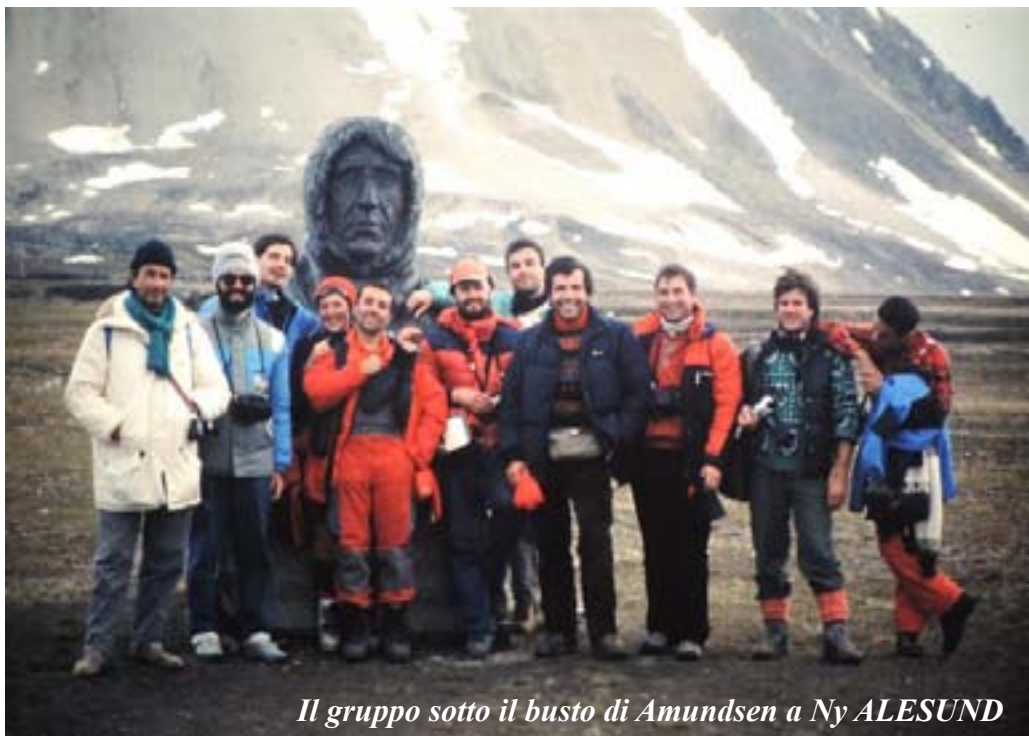
Il gruppo sotto il busto di Amundsen a Ny ALESUND

zurro. Sono le 3 di una notte dolcemente soleggiata e il battello sosta qui in questo luogo riparato un 2 o 3 h per il meritato riposo del suo piccolo equipaggio. Altro ricordo indelebile sono le “Tre Corone”, le tre montagne gemelle in fondo alla stupenda Baia di Ny Alesund, nell'unica splendida e soleggiata giornata di tutto il viaggio, tra l'assalto delle stridenti sterne (rondini artiche) in difesa dei loro nidi tra i cespugli ed il cupo boato dei ghiacci dei giganteschi Konsvegen e Kronenbreen che si spezzano in mare. Osserviamo meravigliati singolari specie di fiori simbolo di una natura che non conosce limiti, molte renne nane e lo spettacolo di migliaia di uccelli appollaiati tra le rocce laggiù in fondo alla Baia dei Re. Li raggiungiamo dopo una lunga camminata attraverso il guado di gelidi torrentelli ed il terreno acquitrinoso della tundra ( mollisol ), fatto di sterminate distese di bassi, spugnosi cuscinetti di muschi e licheni. Fascino delle Svalbard dicevo, ma questo vale soprattutto per la costa nord occidentale della Spitzbergen, che si differenzia dal resto per la geologia particolare costituita da rocce metamorfiche antiche. Fu proprio il profilo acuminato delle sue montagne a suggerirne il nome, derivante da “spitz” che significa cima appuntita. Ma parliamo ancora della loro natura,