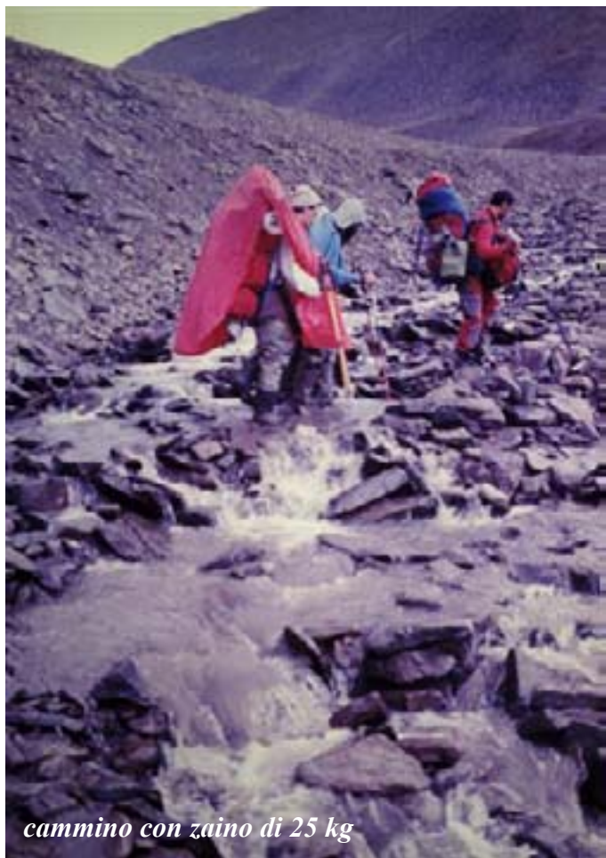
cammino con zaino di 25 kg

vegia a cui è stata riconosciuta sovranità dal 1925, in virtù di un trattato internazionale tenutosi a Parigi nel 1920 e di cui fece parte anche l'Italia. Sono pressoché disabitate ad esclusione di qualche base radiometeorologica e di 5 villaggi minerari di cui 3 norvegesi: Longyearbyen, il principale con aeroporto