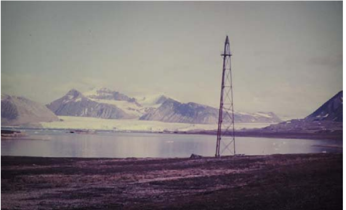
Il pilone dove fu ancorato il dirigibile Italia prima dello sfortunato sorvolo polare Molti uccelli popolano l'arcipelago in estate